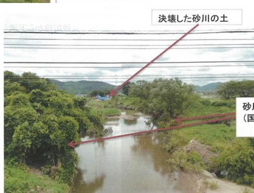
決壊した砂川の土