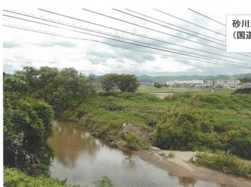
砂川河川内に生育する樹木の状況 (国道250から北方を撮影)