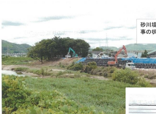
砂川堤防決壊現場の復旧工 事の様及び河川内に生育