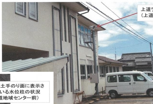
上道ライブカメラの状況 (上道地域センターに設置)