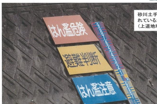
砂川土手のり面に表示さ れている水位柱の状況 (上道地域センター前)