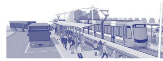
LRT化のイメージ

日本共産党は交通・移動の権利の確立を求めています。「規制緩和」などの市場競争万能路線を改め、国と自治体、事業者等の責任と共同で財源を確保します。どこに住んでも買い物や病院に行ける交通こそ必要です。