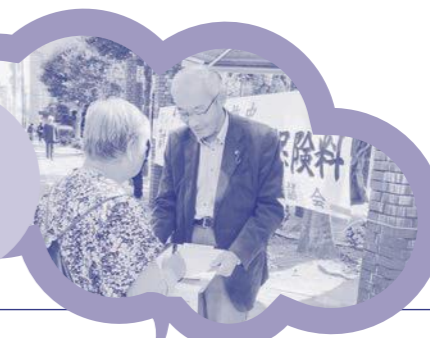
「国保署名」今年も集めます